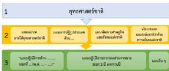
การกำหนดขอบเขตผู้เกี่ยวข้องในแผน